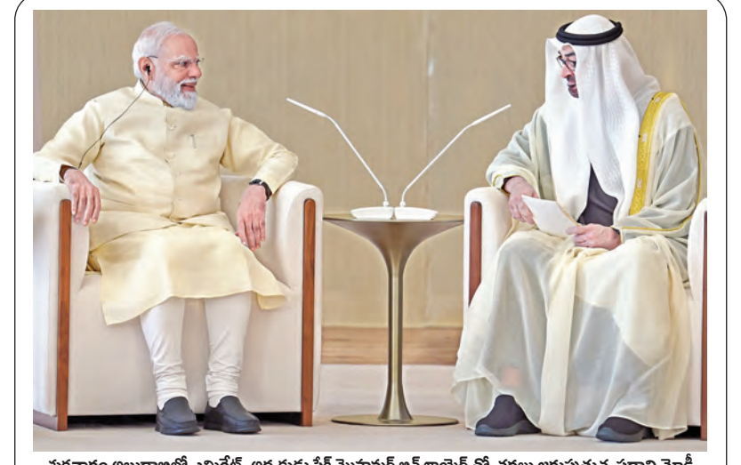
శుక్రవారం అబుదాబిలో ఎమిరేట్స్ అధ్యక్షుడు షేక్ ముహమ్మద్ బిన్ జాయీద్ తో చర్చలు జరుపుతున్న ప్రధాని మోడీ

వచ్చే యేడాది నుంచి ఆన్ లైన్ ప్రశ్నపత్రం లీకే నిందితులను వదలం: కేంద్రమంత్రి ధర్మేంద్ర ప్రధాన్ హైదరాబాద్, ప్రధానమంత్రి మే 15: ఈ నెల 3న జరిగిన సీట్ పరీక్షను రద్దుచేసిన నేపథ్యంలో తిరిగి పరీక్షను జూన్ 21న నిర్వహించనున్నట్లు కేంద్రం ప్రకటించింది. అలాగే ఇక్కడ సీట్ ప్రశ్నాపత్రం లీకే కాకుండా ఉండటం కోసం వచ్చే యేడాది నుంచి పరీక్షను ఆన్ లైన్ లో నిర్వహించాలని నిర్ణయించినట్లు కేంద్ర విద్యాశాఖ మంత్రి ధర్మేంద్ర ప్రధాన్ వెల్లడించారు. సీట్ పరీక్ష రద్దు అనంతరం పరిణామాలు నేపథ్యంలో కేంద్ర మంత్రి గురువారం ఉన్నతస్థాయి సమావేశాన్ని తన నివాసంలో నిర్వహించారు. సమావేశంలో తిరిగి పరీక్షను నిర్వహించడంపై సుదీర్ఘంగా చర్చించి జూన్ 21న తిరిగి నిర్వహించాలని నిర్ణయించారు. ఇందుకు సంబంధించిన విషయాలను కేంద్రమంత్రి ధర్మేంద్ర ప్రధాన్ శుక్రవారం మీడియాకు తెలిపారు. వచ్చే యేడాది 2027-28 నుంచి ఆన్ లైన్